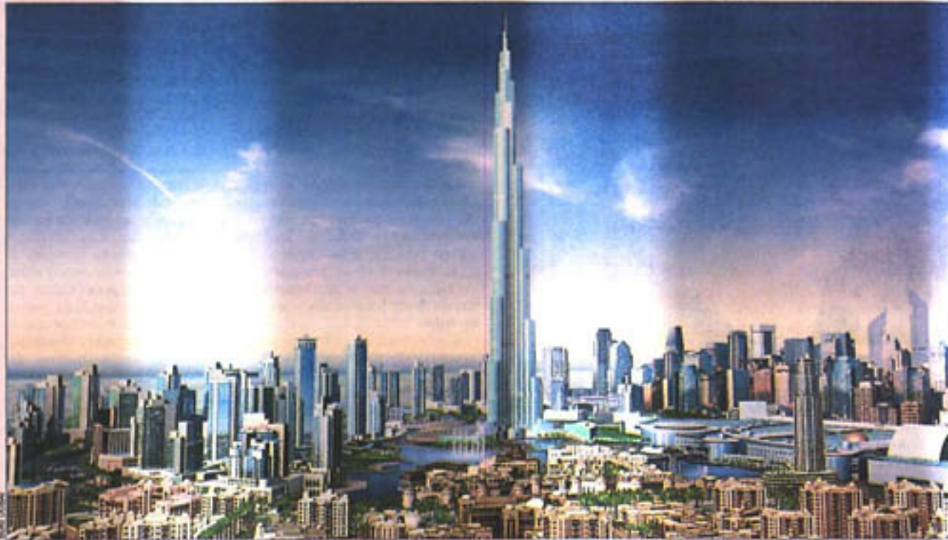
Nuevo proyecto. Absoluto hermetismo guarda Leslie Robertson respecto del edificio Burj Dubai, que será el rascacielos más alto del mundo.

Increíble resurrección de un profesional; impresionante segundo aire de un modo de habitar el mundo que pareció que estaba condenado a la extinción después del 11-S.