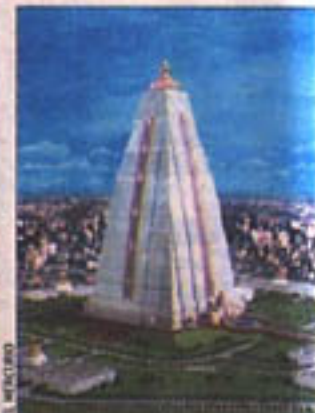
La Maharishi Tower o Torre de la Paz se levantará en Sao Paulo.