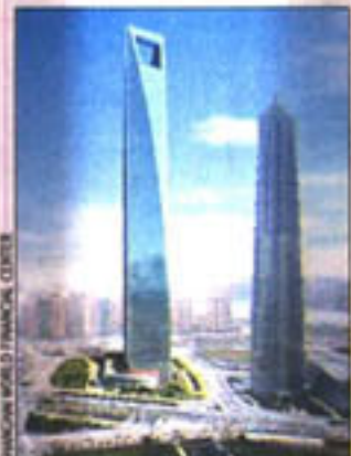
Shanghai World Financial Center estará listo durante el año 2007.

"Cada cultura debe decidir de acuerdo a sus necesidades. En nuestra oficina, cuando diseñamos un edificio en cualquier parte del mundo, lo que nos interesa es conocer la cultura, cuáles son las formas de vivir y la tecnología que se aplica en cada país o ciudad. Luego diseñamos algo que sea apropiado. Pero siempre empujando los límites de lo tradicional", concluye.