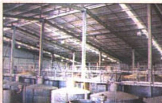
El sistema constructivo en acero presenta claras ventajas frente a otros materiales, como su industrialización, modulación y reducción de faenas en terreno, entre otras.